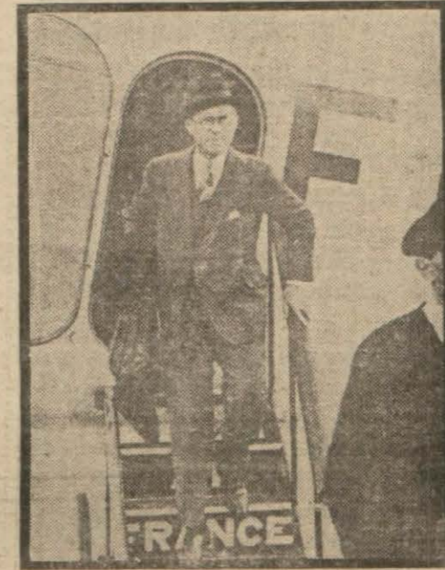
Almanların, Vaşington namına yaptıkları vâdilerle Avrupa harbine sebeb olduklarını iddia ettikleri iki Amerika elçisi

Fransız gazeteleri: “Almanya Ruzvelt'in tekrar Reiscümhur olmasına mâni olmak için manevra çeviriyor,, diyorlar