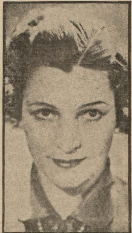
Büyük san'atkâr Germaine Rouer

Bir gün evvel Mari Belle yaptığım mülâkatta olduğu gibi, sabır ve tevekkül (Devamı 8 inci sayfada)