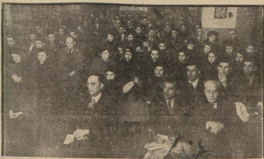
Eminönü Halkevinde dün geceli toplantıya iştirak edenler